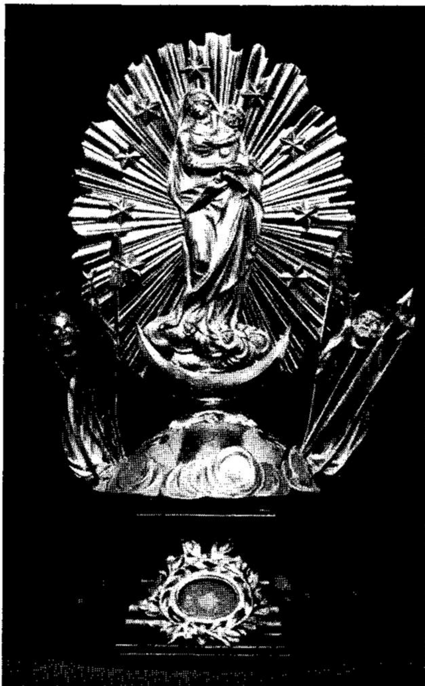
Reliekschrijn (XVIIIe eeuw)

In 1875 werd de predikant van het oktaaf, de E.H. Lamotte door twee kleine jongentjes, alias engeltjes, een missaal aangeboden in rood marokijnen band. In 1876 werd de offering der kinderen voor de eerste maal gedaan op een zondag te 3 uur, en niet meer op zaterdag. Alle straten der parochie