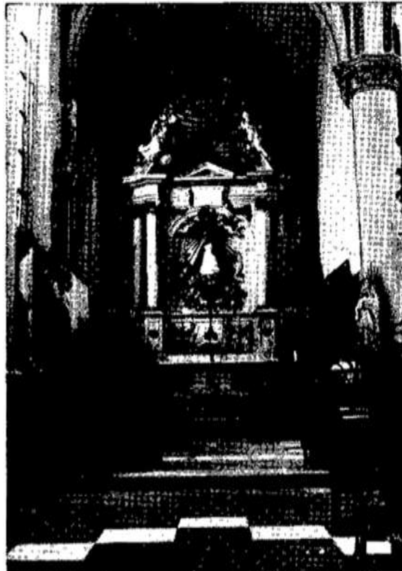
O. L. Vrouwekapel in St.-Andrieskerk